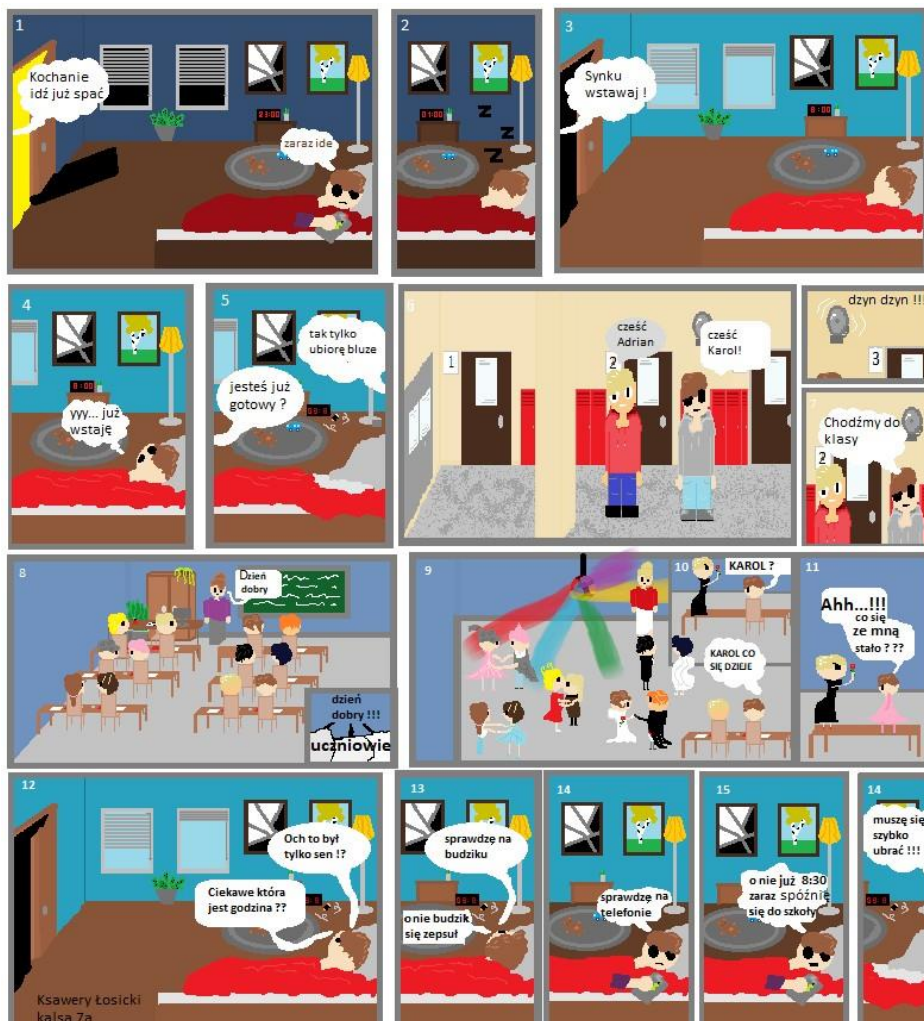
Komiks Ksawerego Łosickiego